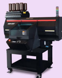
Mimaki 3DUJ-2207 3D UV štampa punog kolora