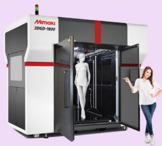
Mimaki 3DGD-1800 3D gel štampa predmeta visine do 180cm