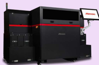
Mimaki 3DUJ-553 3D UV štampa punog kolora